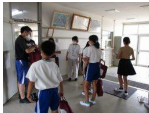
児童が先生から本を受け取っている様子

お母さんとネットで見て、本をえらんでいます。おはなしがすきだから、お母さんとおもしろそうな本を見つけてかっています。かりた本は、おうちにもってかえていっしょによんでいます。