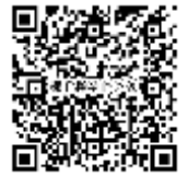
催しものカレンダー